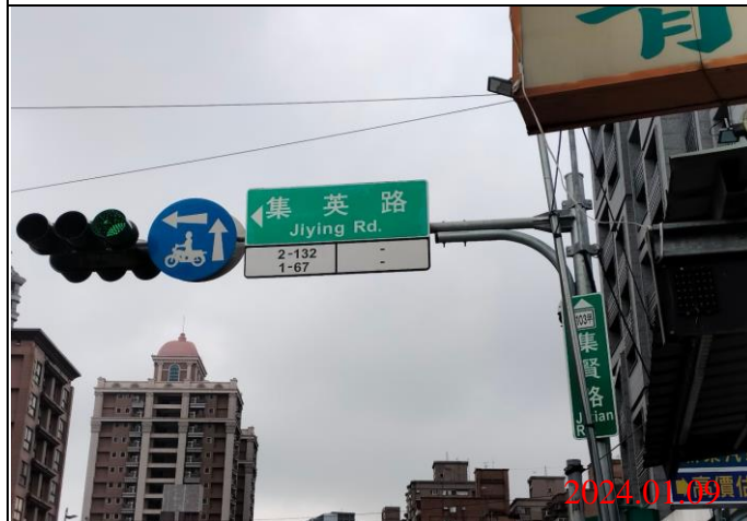
巡查日期地點：113.01.09/ Y22車站 照片說明：牌面設置狀況