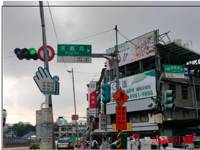
巡查日期地點：113.01.09/ Y21車站 照片說明：牌面設置狀況