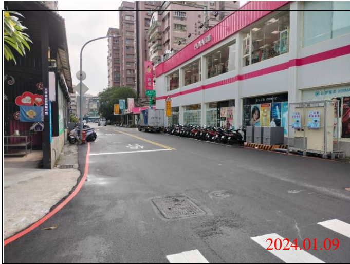
巡查日期地點：113.01.09/ Y21車站 照片說明：路面狀況