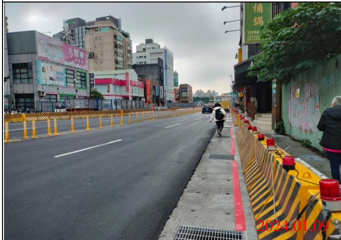
巡查日期地點：113.01.09/ Y21車站 照片說明：路面狀況