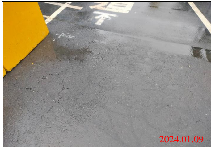
巡查日期地點：113.01.09/ Y23車站 照片說明：路面龜裂狀況