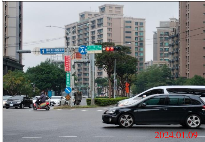
巡查日期地點：113.01.09/ Y23車站 照片說明：牌面設置狀況