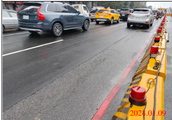
巡查日期地點：113.01.09/ Y23車站 照片說明：路面龜裂狀況