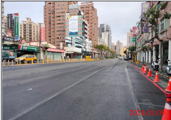
巡查日期地點：113.01.09/ Y21車站 照片說明：路面狀況