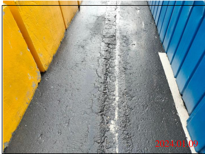
巡查日期地點：113.01.09/ Y23車站 照片說明：路面龜裂狀況