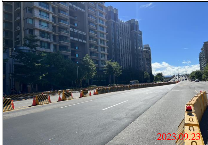
巡查日期地點：112.09.23/ Y23車站 照片說明：路面狀況