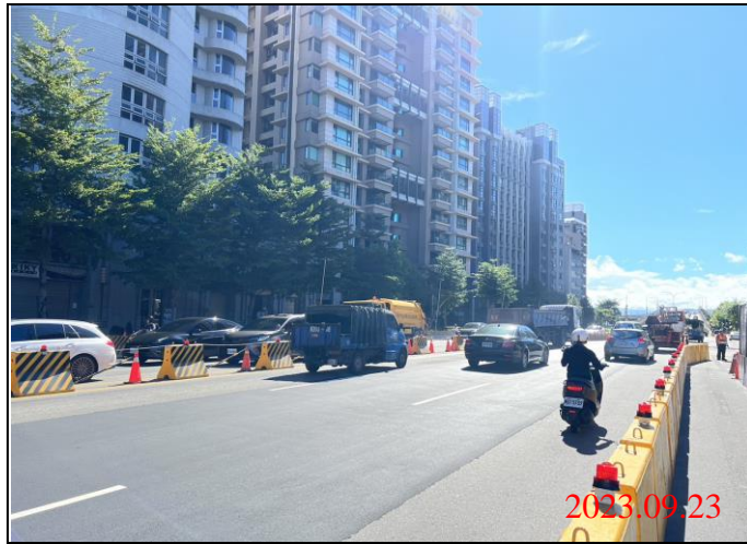
巡查日期地點：112.09.23/ Y23車站 照片說明：路面狀況