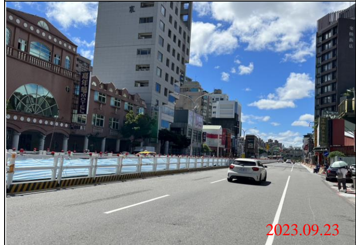
巡查日期地點：112.09.23/ Y21車站 照片說明：路面狀況