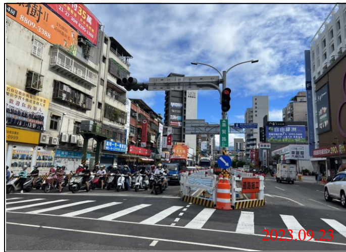
巡查日期地點：112.09.23/ Y21車站 照片說明：牌面設置狀況