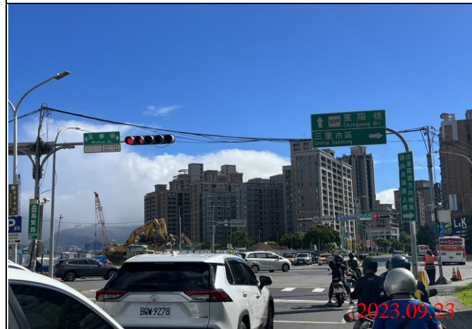
巡查日期地點：112.09.23/ Y22車站 照片說明：牌面設置狀況