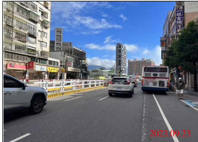
巡查日期地點：112.09.23/ Y22車站 照片說明：路面狀況