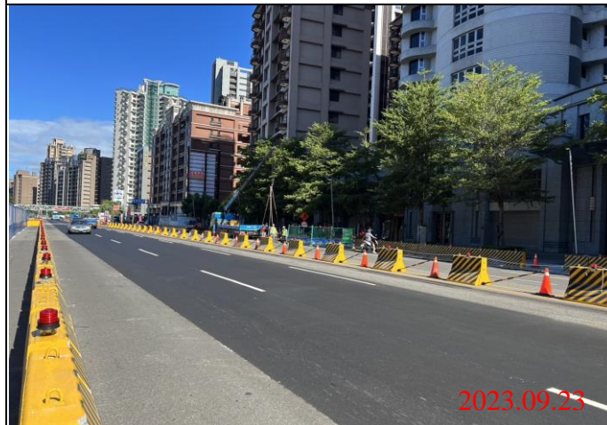
巡查日期地點：112.09.23/ Y23車站 照片說明：路面狀況