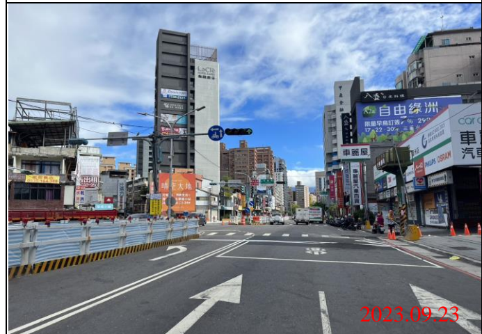
巡查日期地點：112.09.23/ Y21車站 照片說明：路面狀況