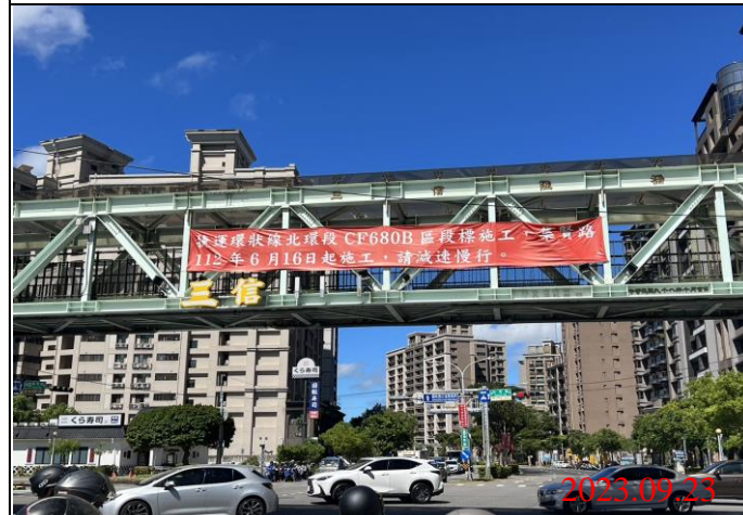
巡查日期地點：112.09.23/ Y23車站 照片說明：牌面設置狀況