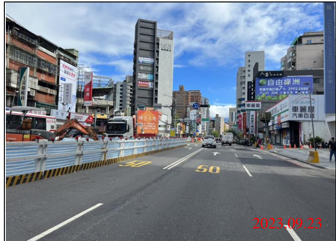
巡查日期地點：112.09.23/ Y21車站 照片說明：路面狀況