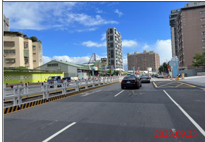
巡查日期地點：112.09.23/ Y22車站 照片說明：路面狀況