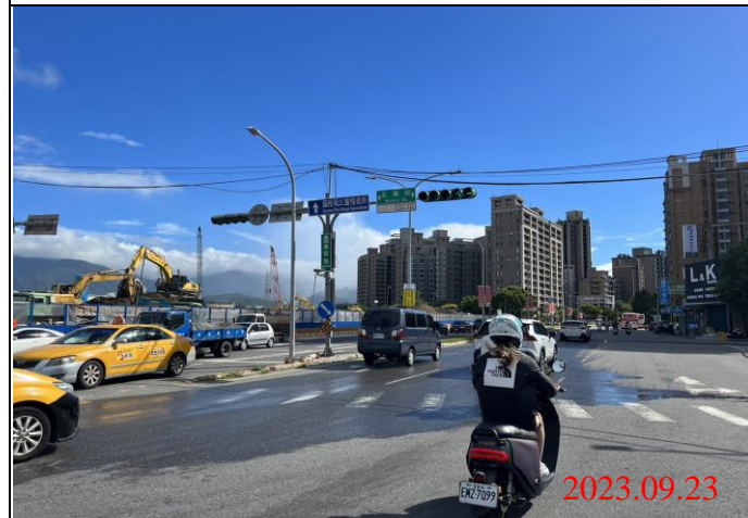
巡查日期地點：112.09.23/ Y22車站 照片說明：路面狀況